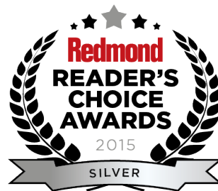
Redmond Reader's Choice Awards - Migration Tool

Unternehmenswachstum erforderlichen Innovationen konzentrieren können. Die skalierbaren, erschwinglichen und benutzerfreundlichen Lösungen von Quest® ermöglichen eine beispiellose Effizienz und Produktivität. Quest lädt Benutzer dazu ein, Teil einer innovativen globalen Gemeinschaft zu werden, und unternimmt alle Anstrengungen, den Anforderungen seiner Kunden gerecht zu werden. Daher wird das Unternehmen auch weiterhin die Bereitstellung der umfassendsten Lösungen für Azure Cloud-Management, SaaS, Sicherheit, mobile Mitarbeiter und datenbasierte Einblicke vorantreiben.